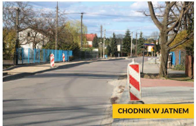
CHODNIK W JATNEM