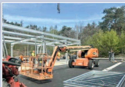
Nowoczesny PSZOK - str. 7-8