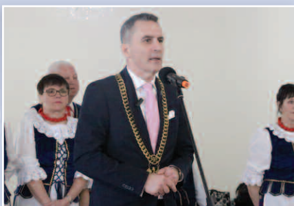
Złote Gody - str. 14-17