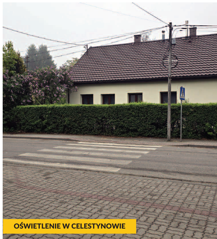
OŚWIETLENIE W CELESTYNOWIE

To niezwykle ważne i długo wyczekiwane przez mieszkańców naszej gminy zadania inwestycyjne. Ich realizacja nie tylko poprawi stan nawierzchni, lecz także usprawni komunikację, zwiększy rozwój infrastruktury oraz wzmocni bezpieczeństwo wszystkich uczestników ruchu drogowego.