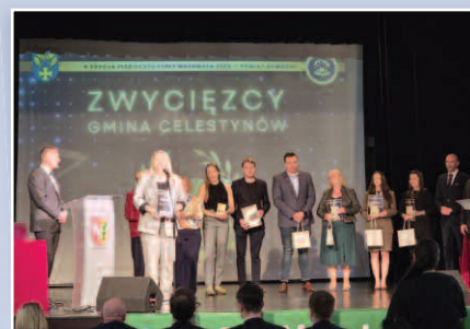
Perły Mazowsza - str. 12