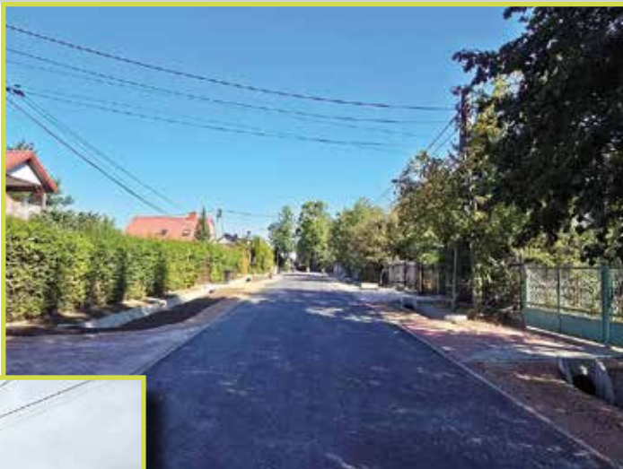
Celestynów ul. Radzińska

ul. Kolejowej w Pogorzeli”. Wykonawca jest firma JTM Construction Sp z o. o. Koszt inwestycji to około 480.000,00 zł .