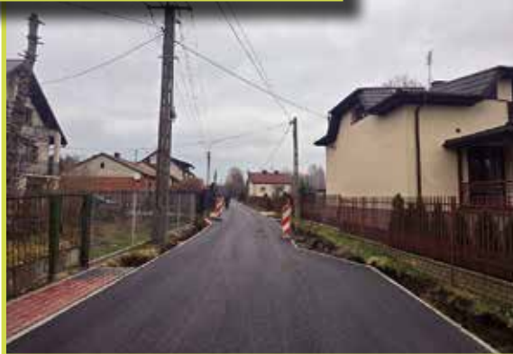
Pogorzeli, ul. Piękna

344 mb. w ramach zadania inwestycyjnego pn.: „Budowa drogi gminnej nr 270173W w miejscowości Ponurzyca”. Wykonawcą jest firma BUD-MAX Sp z o.o. Koszt inwestycji to około 900.000,00 zł .