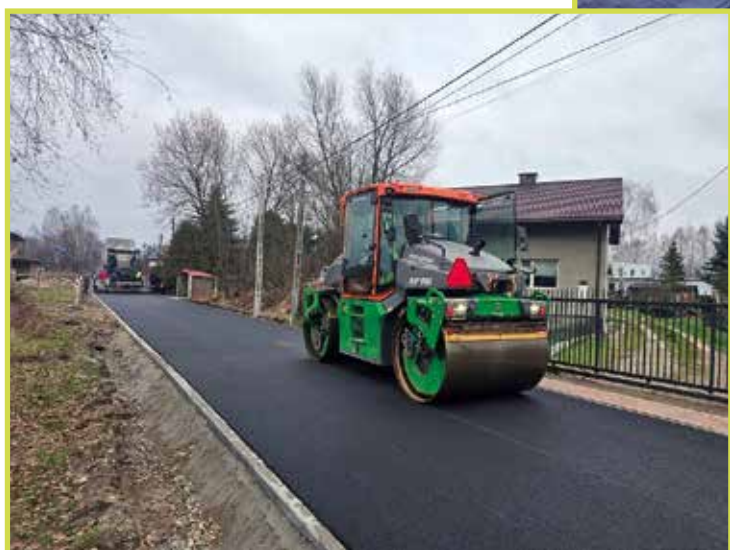
Pogorzeli, ul. Kolejowa

344 mb. w ramach zadania inwestycyjnego pn.: „Budowa drogi gminnej nr 270173W w miejscowości Ponurzyca”. Wykonawcą jest firma BUD-MAX Sp z o.o. Koszt inwestycji to około 900.000,00 zł .